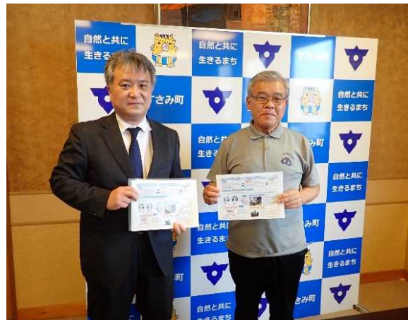
岩田町長と共に (令和4年5月17日)