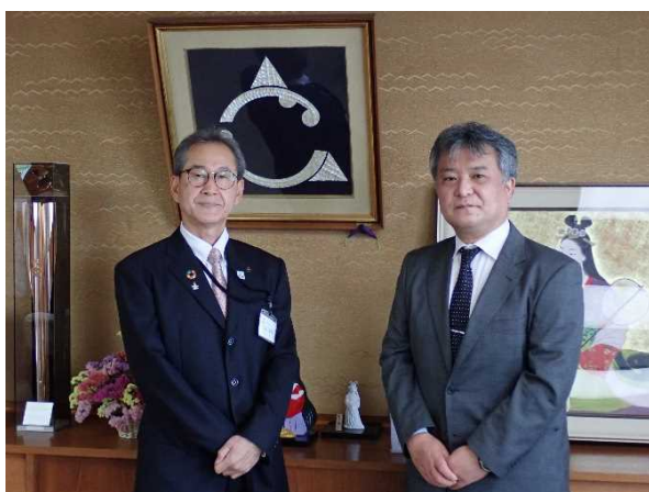
三浦市長と共に（令和4年5月24日）