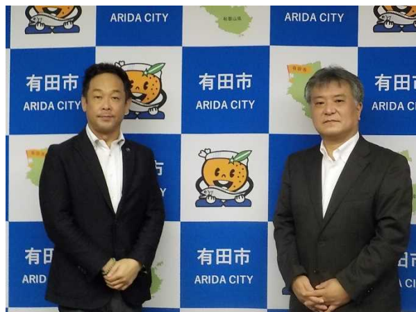
望月市長と共に（令和4年6月16日）