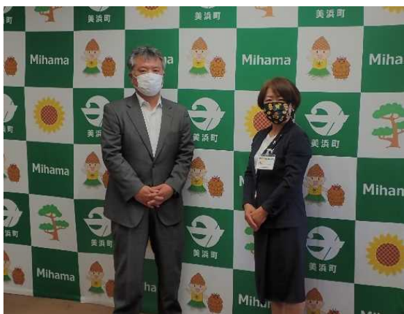
簗内町長と共に (令和4年5月30日)