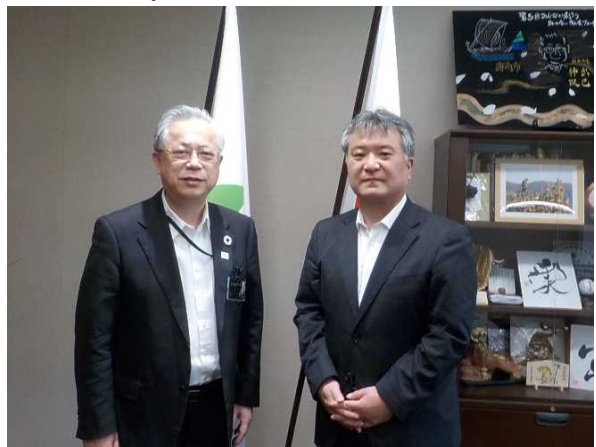
神出市長と共に（令和4年6月3日）