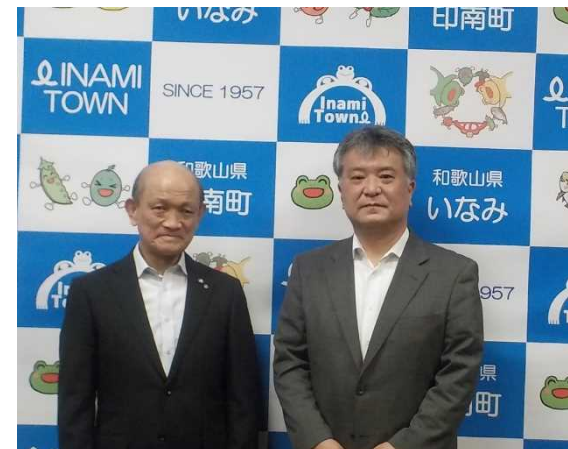
日裏町長と共に（令和4年6月8日）