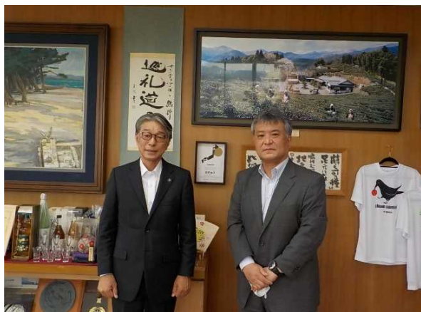
真砂市長と共に (令和4年6月1日)