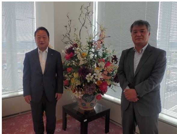
岸本市長と共に（令和4年6月6日）