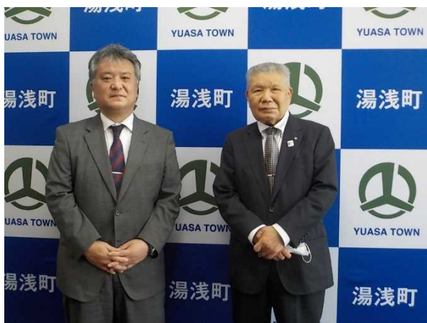
上山町長と共に (令和4年5月16日)