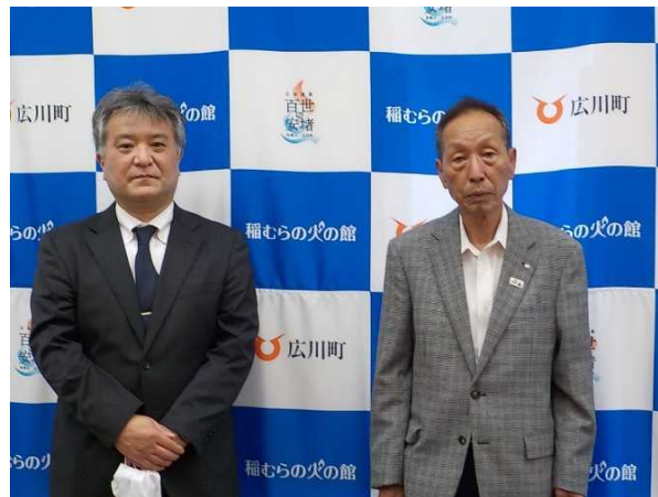
西岡町長と共に (令和4年5月19日)