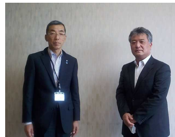
小川町長と共に (令和4年5月31日)