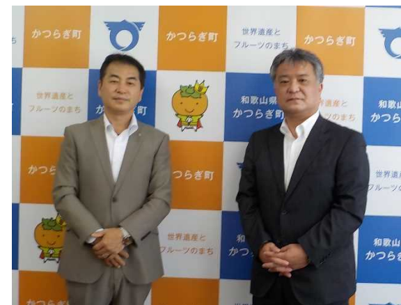
中阪町長と共に (令和4年6月2日)