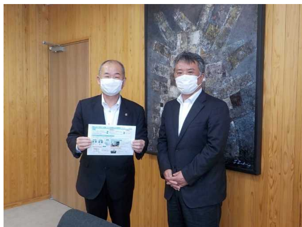
田岡市長と共に（令和4年6月7日）