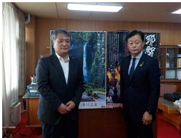
堀町長と共に（令和4年6月7日）