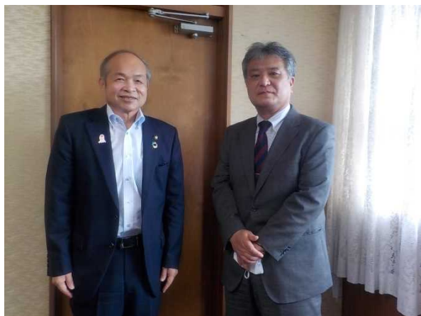
平木市長と共に（令和4年5月25日）