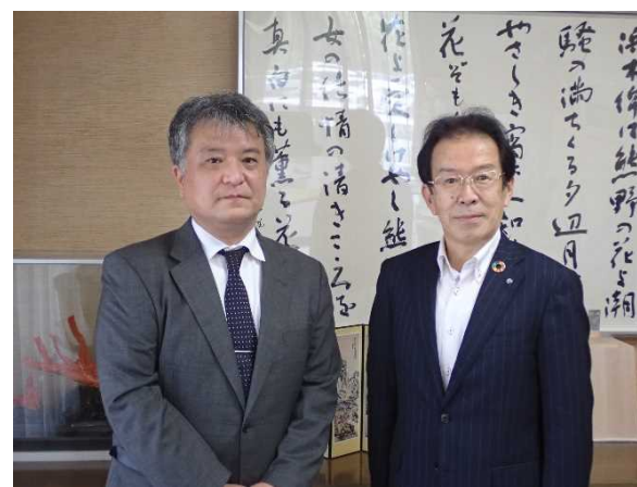
井瀬町長と共に（令和4年5月24日）