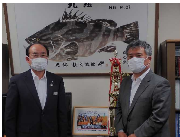
松本町長と共に (令和4年5月30日)