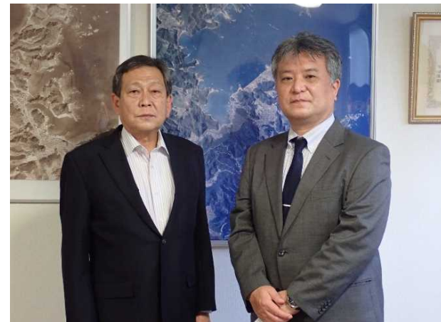
漁野副町長と共に (令和4年5月18日)