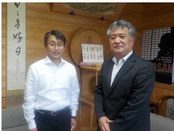
平野町長と共に (令和4年5月31日)