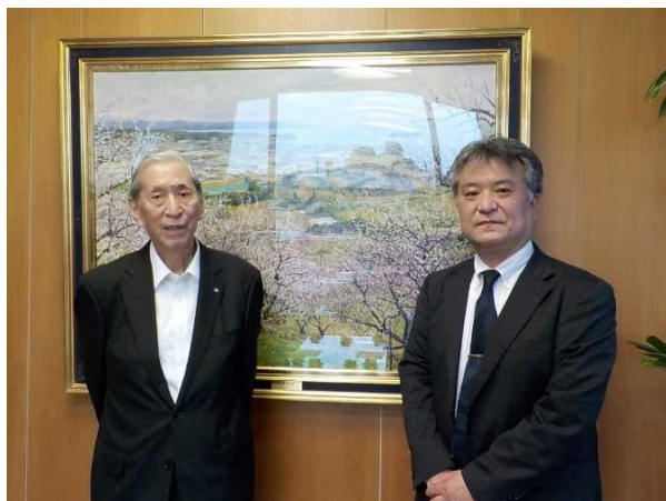
小谷町長と共に (令和4年5月19日)