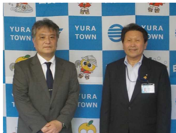
山名町長と共に（令和4年5月20日）