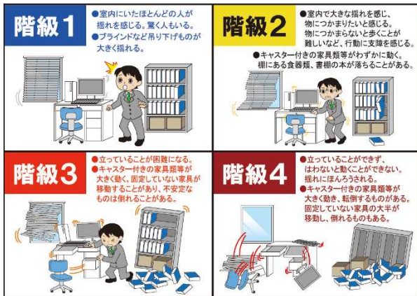
図3 長周期地震動階級

気象庁では、地震発生後直ちに震度に関する情報を発表していますが、震度は地表面付近の比較的周期が短い揺れを対象とした指標であるため、高層ビル高層階の揺れの程度を表現するのに十分ではありません。そこで、高層ビルなどでの的確な防災対応に資することを目的に、概ね14、15階以上での揺れの大きさを、「長周期地震動階級」という指標で表し（図3）、地震発生から10分程度で「長周期地震動に関する観測情報」をオンライン配信するとともに気象庁ホームページ（ https://www.jma.go.jp/bosai/map.html#contents=ltpgm ）でも公開しています（図4）。