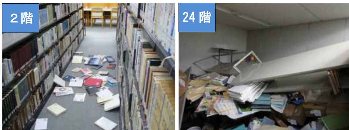
図2 東京都内の同じビル内での被害の違い

図2は「平成23年（2011年）東北地方太平洋沖地震」の際の東京都内のビル内の様子です。このように、長周期地震動によりビルの高層階は大きく揺れ、低層階よりも家具類の転倒などの被害が発生しやすくなります。この他にも、天井の落下やスプリンクラーの故障、エレベーターの障害などの被害が発生しました。