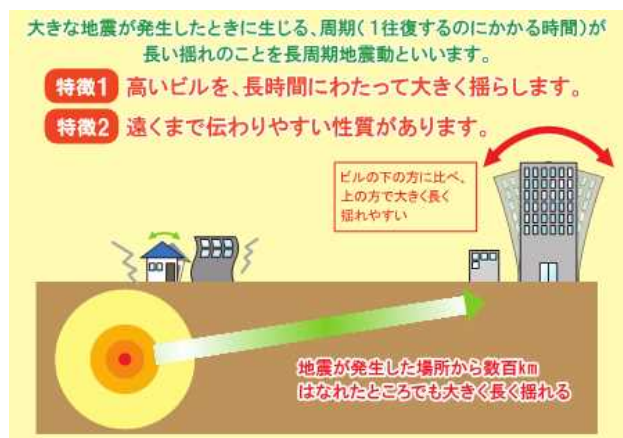
図1 長周期地震動の概要と特徴

地震が起きると様々な周期（揺れが1往復するのにかかる時間）を持つ揺れ（地震動）が発生します。その中でも、規模の大きな地震が発生したときに生じる、周期の長いゆっくりとした大きな地震動のことを「長周期地震動」といいます。長周期地震動には、高層ビルを長時間にわたって大きく揺らし、遠くまで伝わりやすい性質があります（図1）。