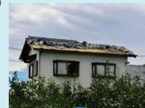
突風被害例 (住家の屋根瓦の飛散)